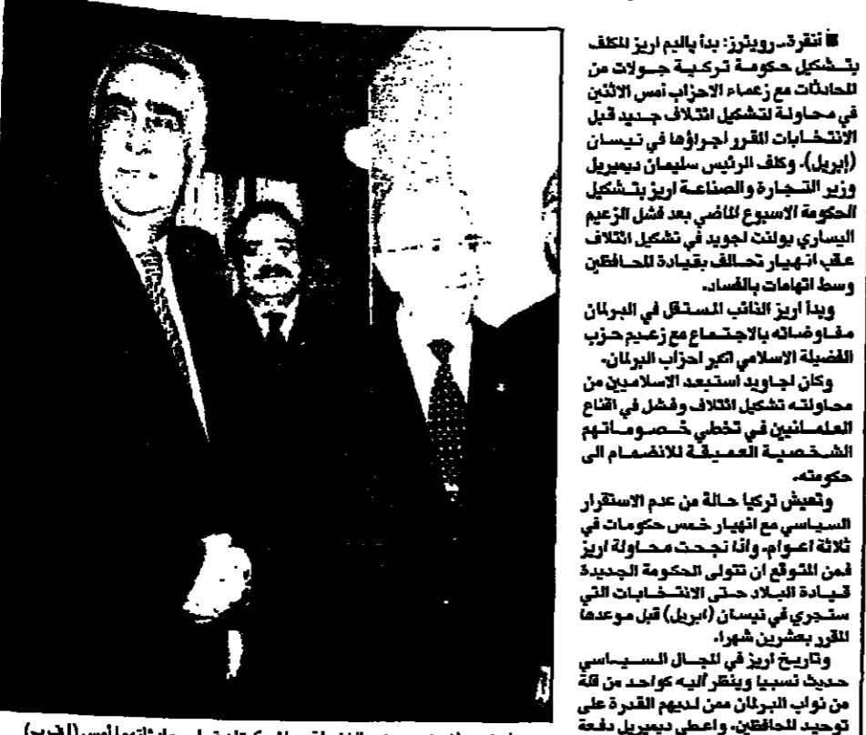
اريز يصالح زعيم حزب الفضيلة رجبتي كوتان قبل محادثاتها (أس (أ ب))

ويصالح زعيم حزب الفضيلة رجبتي كوتان قبل محادثاتها (أس (أ ب))